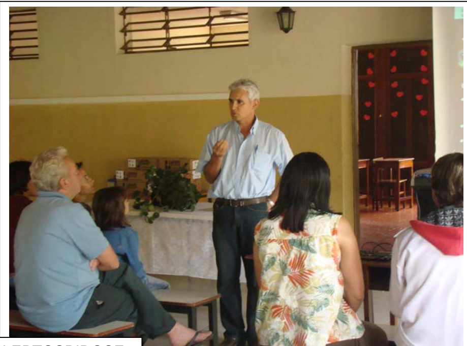
Mobilização :LEPTOSPIROSE Município de Alto Jequitibá, que está sob a jurisdição da GRS Manhumirim