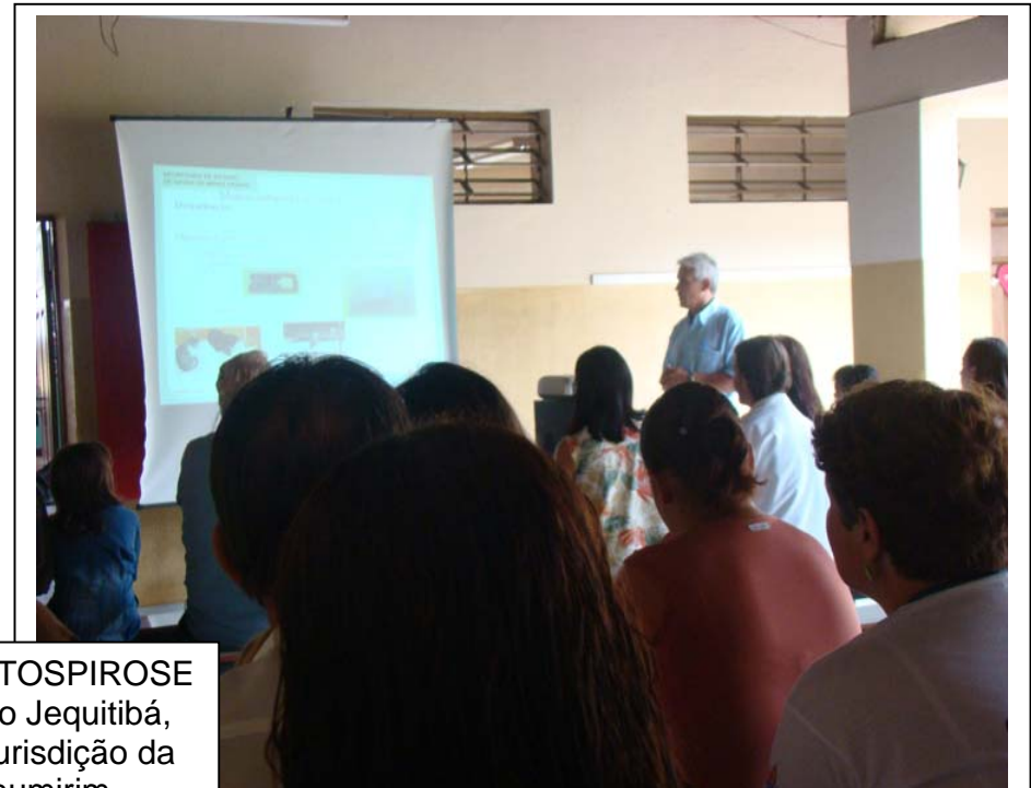
Mobilização: LEPTOSPIROSE Município de Alto Jequitibá, que está sob a jurisdição da GRS Manhumirim