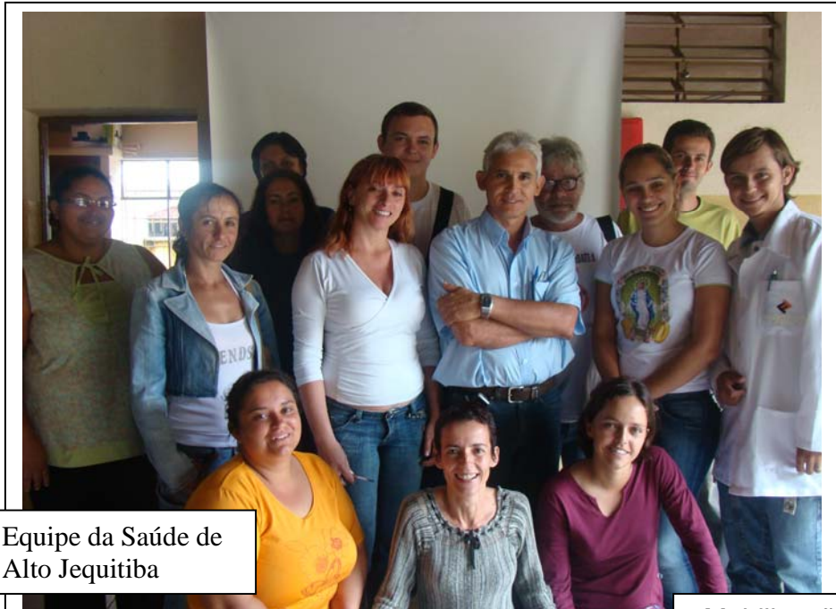
Equipe da Saúde de Alto Jequitiba