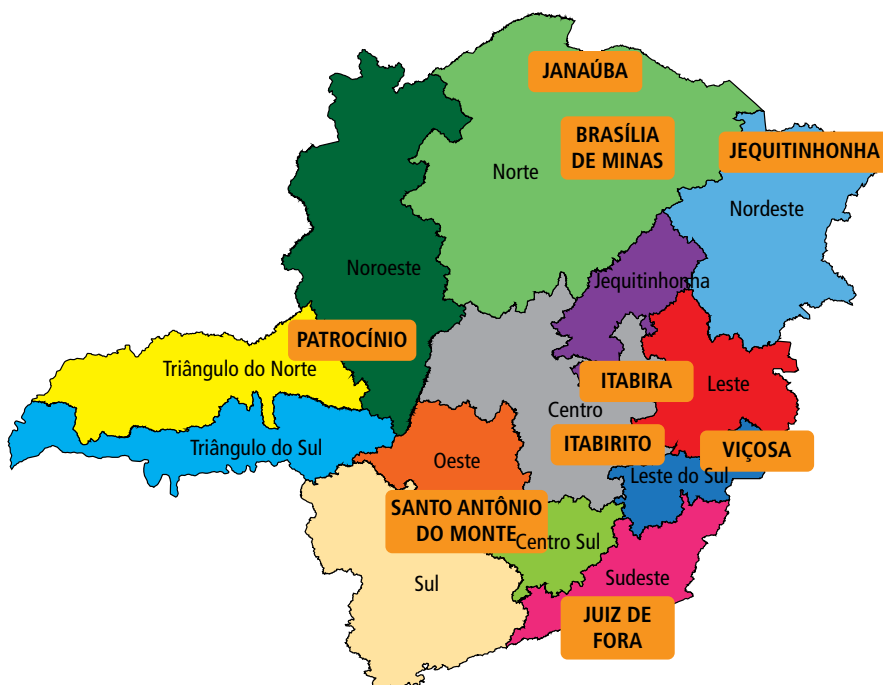
Figura 2. Centros Hiperdia Minas implantados em Minas Gerais até novembro de 2011